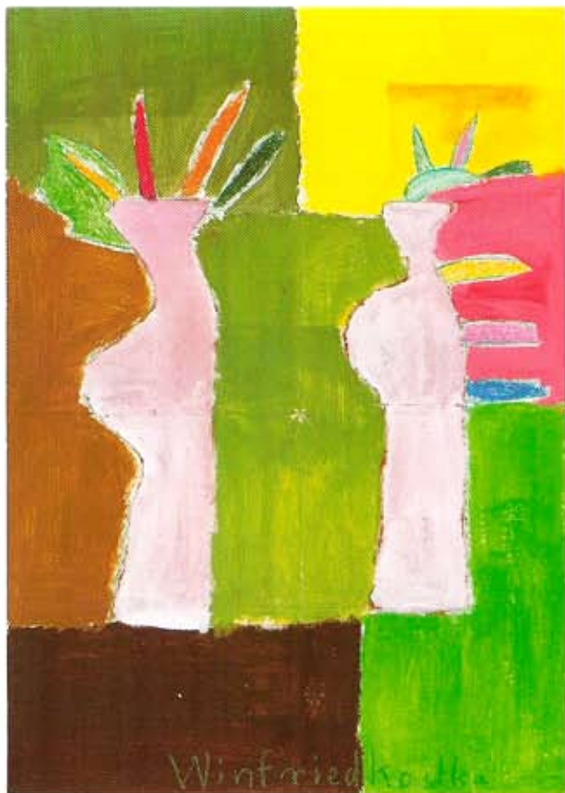
Winfried Kostka: Bäume

Die Ausstellung »Drei Damen haben sich umgezogen und andere Bilder von Künstlern der Lebenshilfe« wurde zusammengestellt von der Bundesvereinigung Lebenshilfe für Menschen mit geistiger Behinderung e.V.