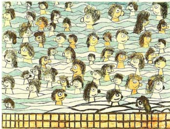
Hans Schön: Schwimmbad in Waibstadt

Die Bilder dieser Ausstellung sind nicht verkäuflich. Bei Interesse an den Arbeiten der ausstellenden Künstler(innen) wenden Sie sich bitte direkt an die Ateliers (siehe nebenstehende Adressen).