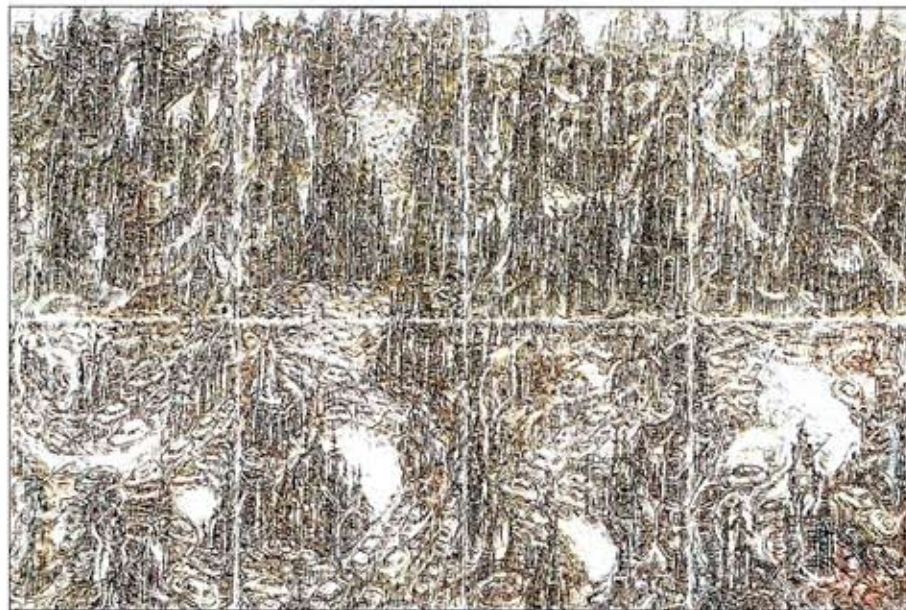
herman bossert, 2007/36, zonder titel, gem.techniek/papier assemblage, 67,5x100 cm