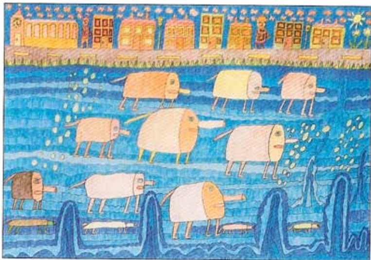
michael hall, nilperde im wasser, 2002, potlood+kleurpotlood/papier, 47x67 cm