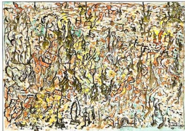
drago jurak, z.t., 1989, gem.techniek/papier, 50,5x70,5 cm