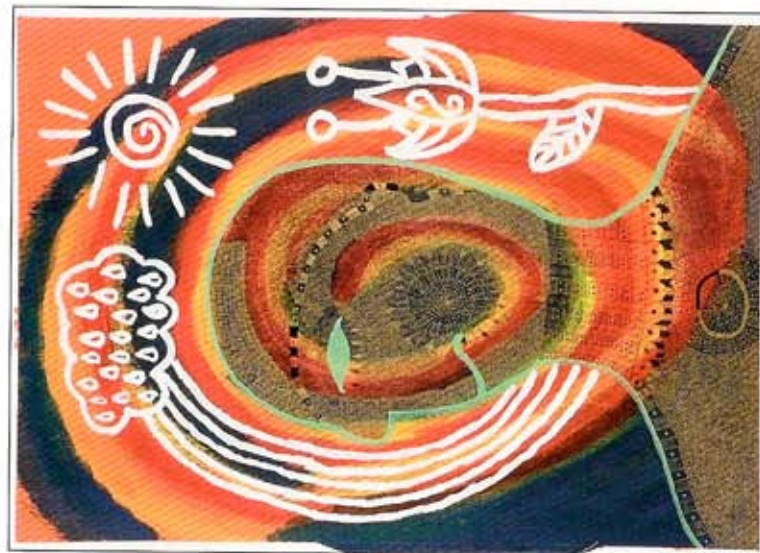
ylonka jaspers, rainbow boy, z.j. gem.technik/papier, 70x50 cm