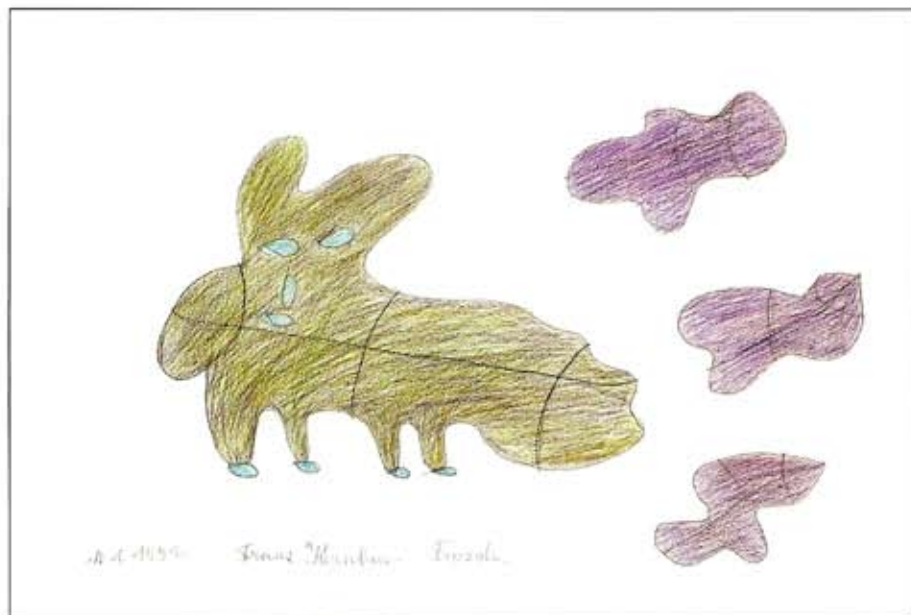
franz kernbeis, frosch, 1991, potlood+kleurpotlood/papier, 44x62,3 cm

Voor meer informatie hierover wordt verwezen naar het artikel 'Termen à la carte' van Nico van der Endt in de uitgave van het Museum Dr. Guislain getiteld 'Verborgene Werelden' (Uitg. Lannoo, Tielt, 2007, ISBN 10 90-209-6590 5)