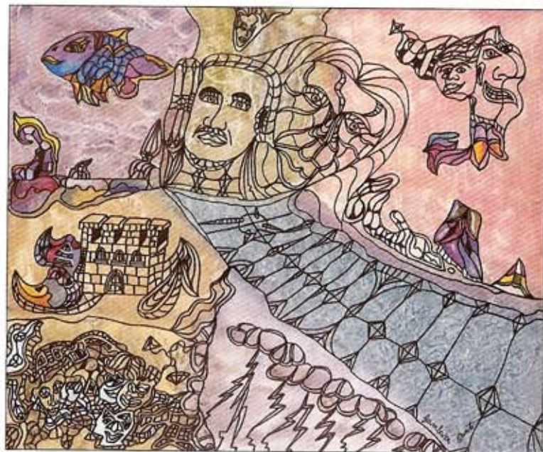
dante gambassi, z.f., s.d., acryl/doek/board, 50x60 cm