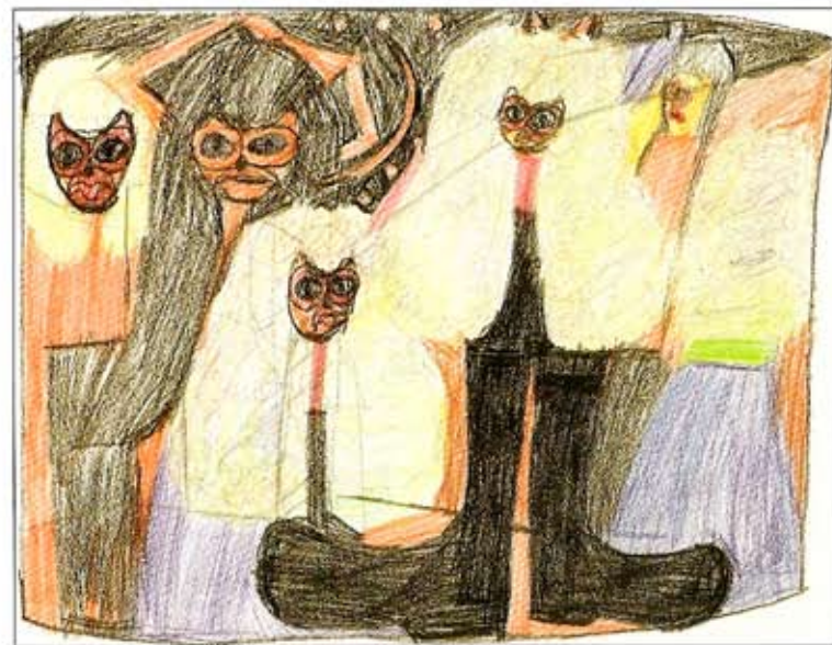
roy wenzel, z.t., ca. 1990, gem.techniek/papier, 50x65 cm