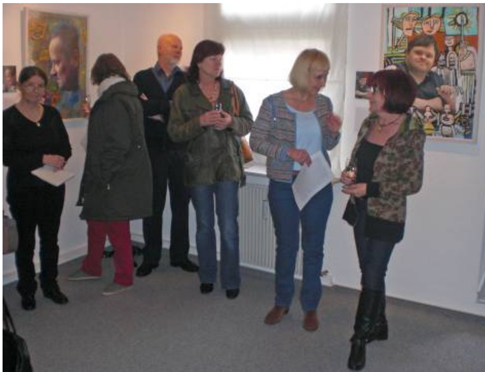
Ausstellung: Outsider-Photography meets Artist 2 mit den Arbeiten der Kraichgauer Kunstwerkstatt, Kulturtreff Altes Rathaus Feudenheim