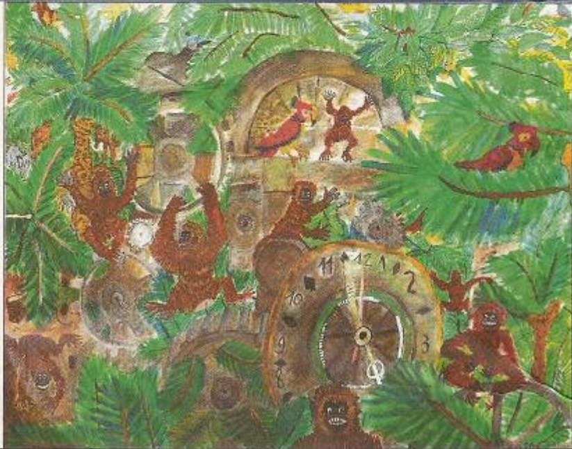
Michael Preiß, „Turmuhr wird Tierspielplatz“, Gouache, 2011

Emmertsgrund. Ausdrucksvolle Bilder über das Phänomen der Zeit präsentiert die Galerie im Augustinum (Jaspersstraße 2) in der Ausstellung „Zeitgeschichten“. Die Werke stammen aus der Kraichgauer Kunstwerkstatt. Sie gehört zur Sinsheimer Kraichgau-Werkstatt für Menschen mit Behinderung, elf Künstler haben dort ihren Arbeitsplatz. International werden ihre individuellen Bildschöpfungen der „Outsider Art“ (auf Deutsch: Außenseiterkunst) zugeordnet. Aus ihrer individuellen Sicht auf das Thema Zeit ergibt sich eine Vielfalt von fantasievollen Darstellungen: Zeitriesenräder, Zeitenvögel oder „rennende Uhren“ kommen in den Kunstwerken vor. Werke der Kraichgauer Künstler wurden bereits international ausgestellt, es gab bereits mehrere Auszeichnungen. web/Foto: Hentschel