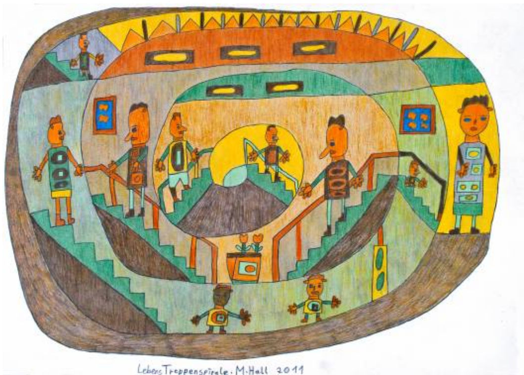
Michael Hall, „Lebens-Treppenspirale“, Farbstifte, 2011