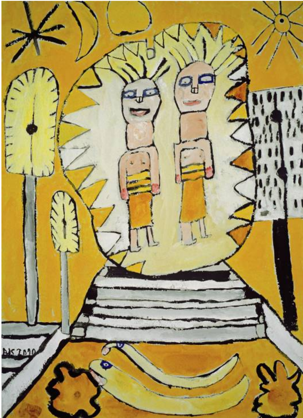
Andreas Kretz, „Zeitmaschine“, Acrylfarbe, 2010