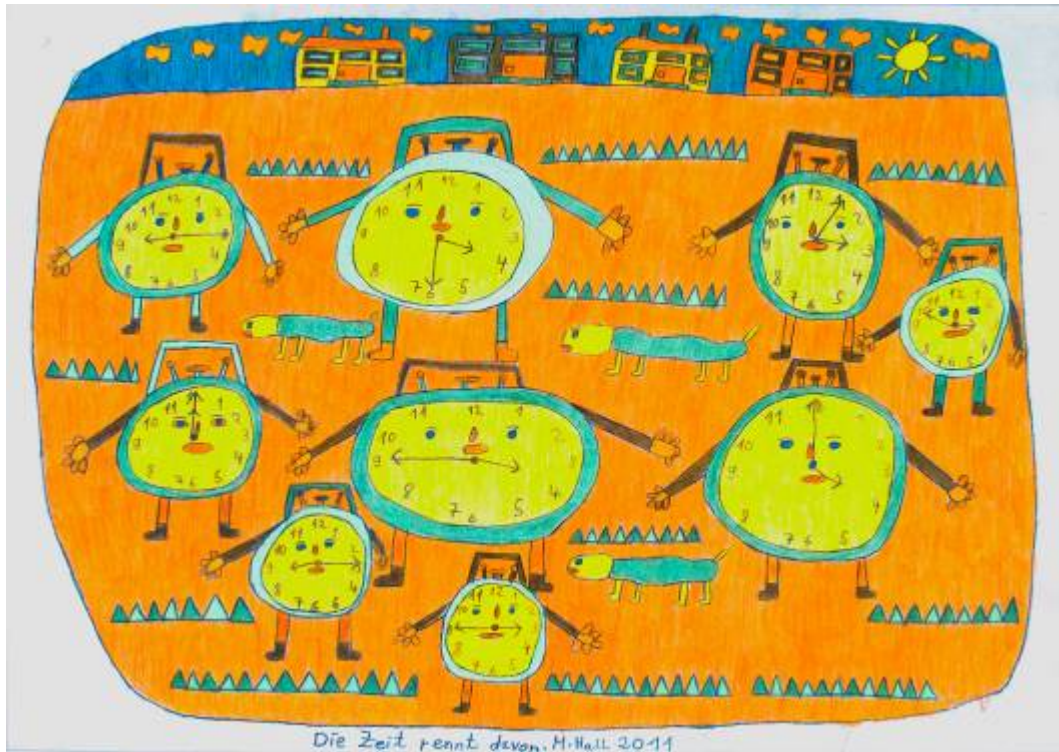
Michael Hall, „Die Zeit rennt davon“, Farbstifte, 2011