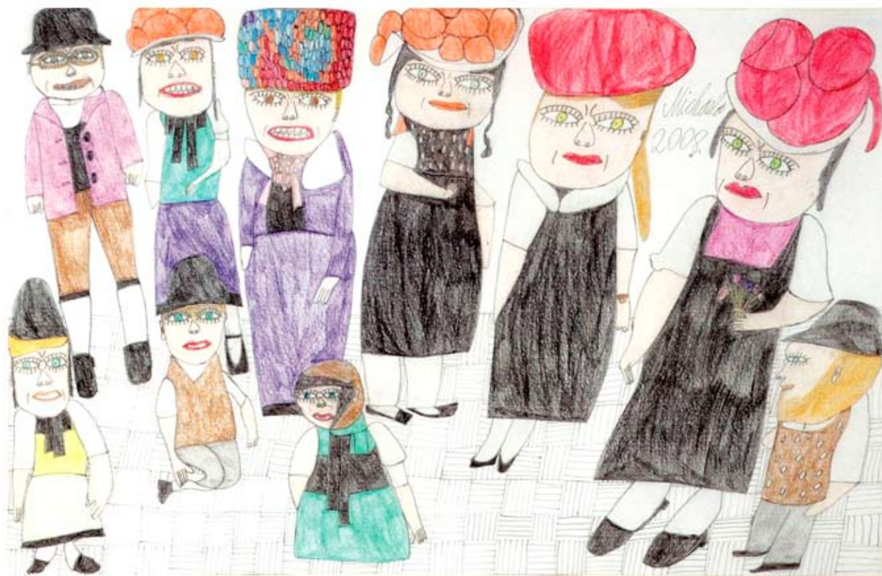
„Schwarzwaldleute“ 37 x 57 cm Farbstifte