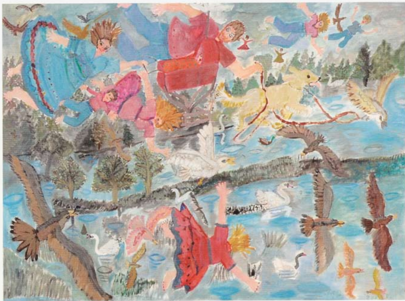
„Im Wind fliegen“ 57 x 77 cm Gouache