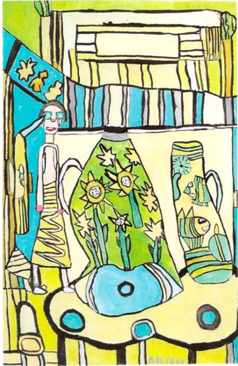
„Krüge auf dem Tisch“ 76 x 50 cm Acryl