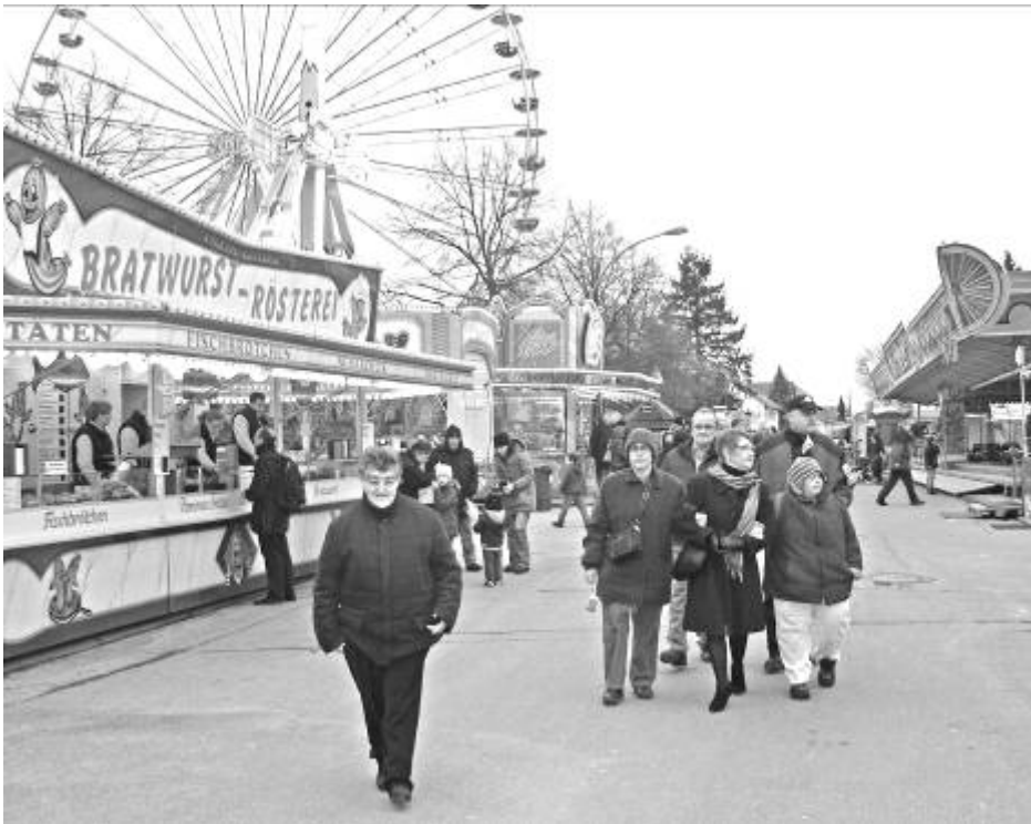
Rundgang über den gerade geöffneten Mathaisemarkt