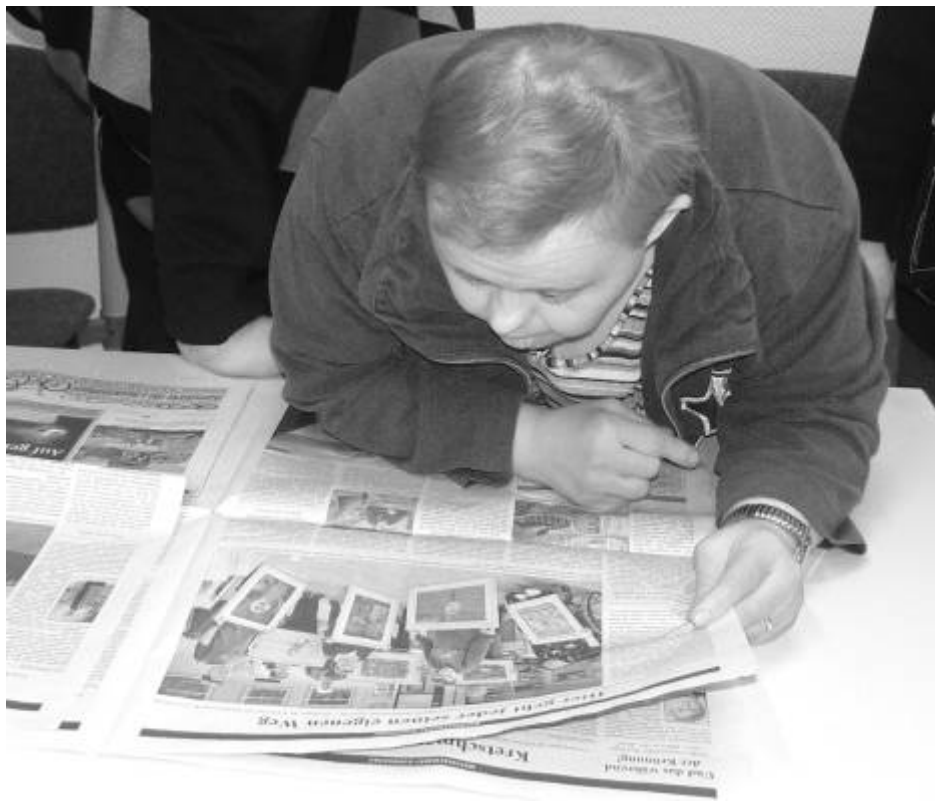
Viele Zeitungen berichteten ausführlich über unsere Ausstellung