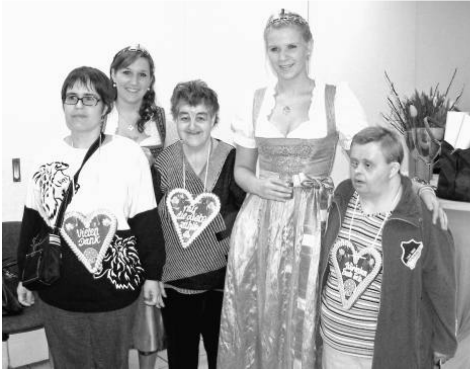
Weinkönigin, Prinzessin und glückliche Künstlerinnen