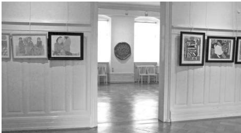
Ausstellung im Museum Haus Cajeth