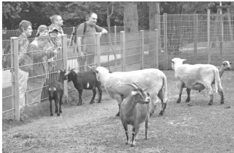
Ausflug in den Wildpark

Ebenfalls im Juni machten wir einen gemütlichen Ausflug in den Wildpark Schwarzach. Weil das Wetter wunderbar war, konnten wir den großen Park mit seinen vielen Tierarten ausgiebig genießen. Vor allem im Eiscafe und später beim Picknick im Grünen.