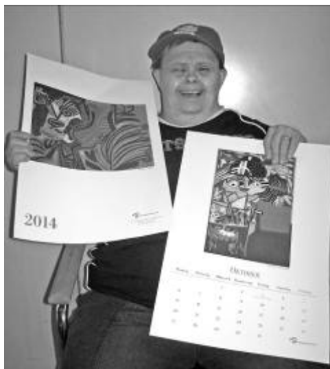
Unser neuer Kunstkalender 2014 mit einem Zauberer und einer schönen Frau von Ulrike Welz

Natürlich haben wir wieder an einem neuen Kunstkalender für das Jahr 2014 gearbeitet. Alle Künstlerinnen und Künstler sind darin vertreten und beschreiben wie in den vergangenen Jahren ihre Bilder in einem kurzen Text. Er kann auf dem Weihnachtsmarkt und in der in Werkstatt gekauft werden.