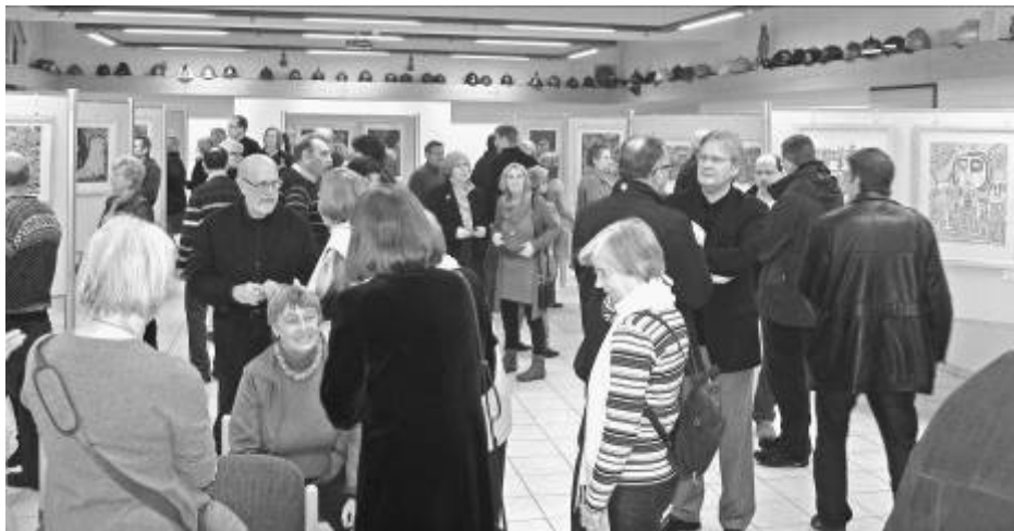
Die Ausstellungseröffnung war sehr gut besucht